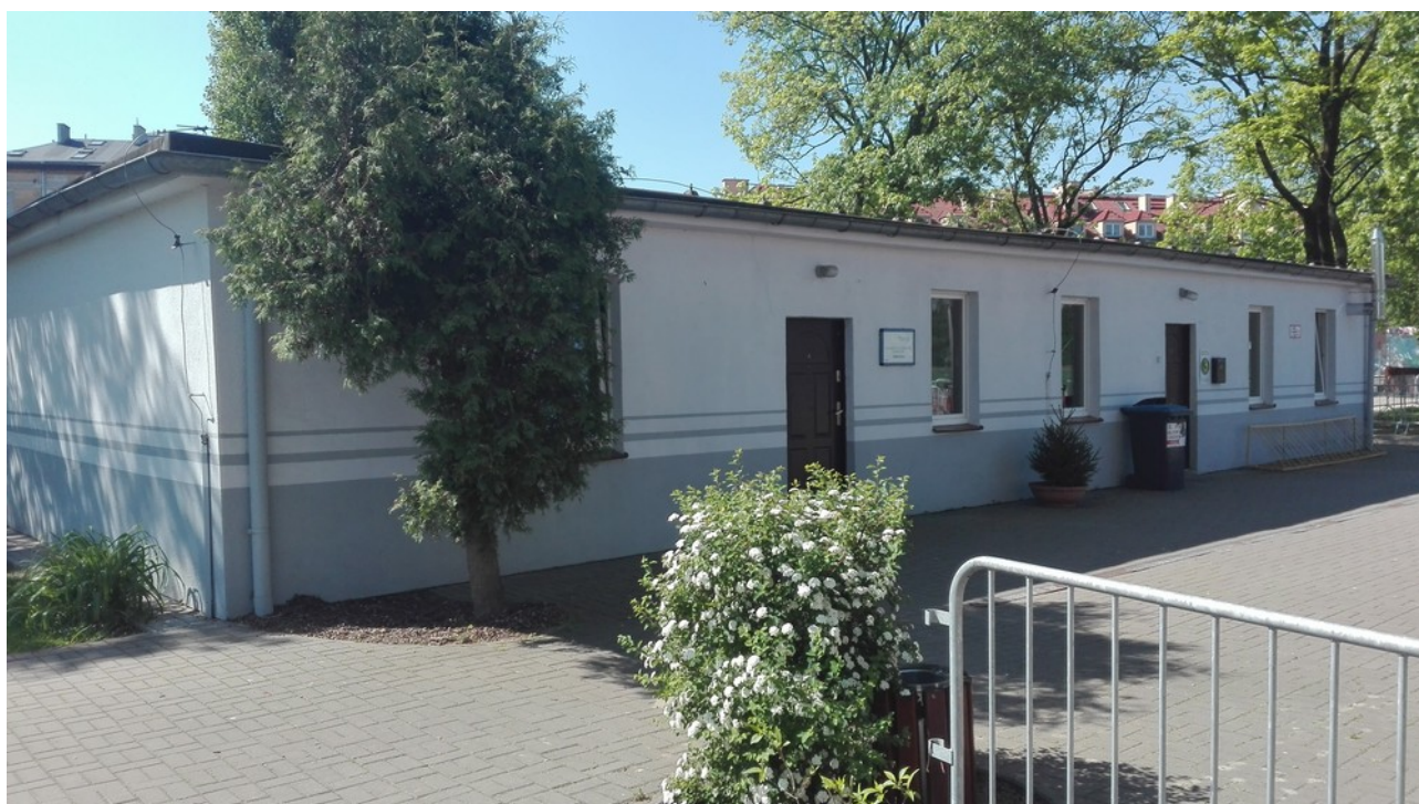
Budynek B (światlica) - MOS ul. Gdańska w Poznaniu, działka nr 4/10, ark. nr 12, obręb 004 Śródka