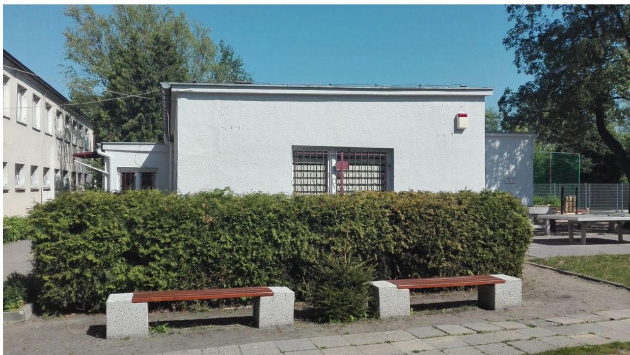
Budynek C (biuro) - MOS ul. Gdańska w Poznaniu, działka nr 4/10, ark. nr 12, obręb 004 Śródka