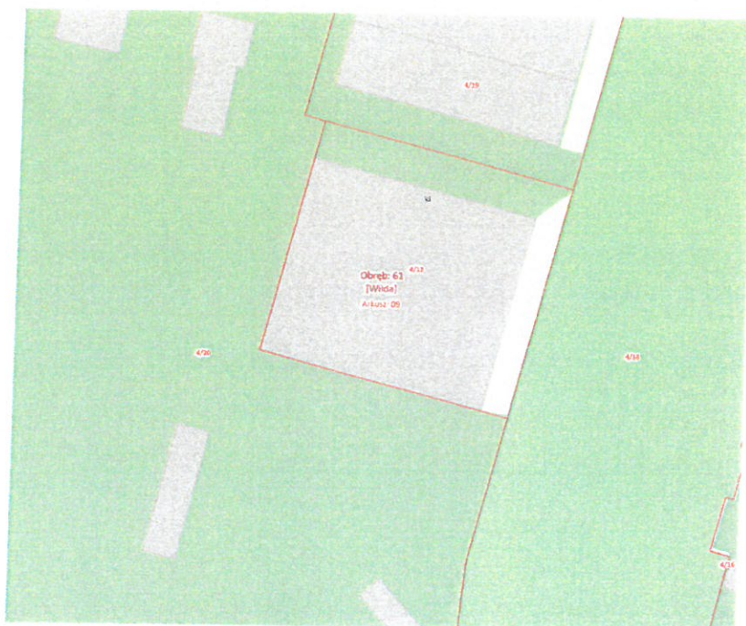
Lokalizacja obiektu: Poznań ul. Chwiałkowskiego 38, działka nr 4/13, ark. nr 09, obręb 061 Wilda.

Działka gruntu nr 4/13 o powierzchni 2092 m 2 posiada kształt regularny – prostokąt, teren o płaskim ukształtowaniu. Działka zabudowana budynkiem w zabudowie wolnostojącej, składającym się z dwóch części jednokondygnacyjnych naziemnych o powierzchni użytkowej 1469,31 m 2 . Teren zagospodarowany i częściowo utwardzony kostką betonową stanowiącą parking.