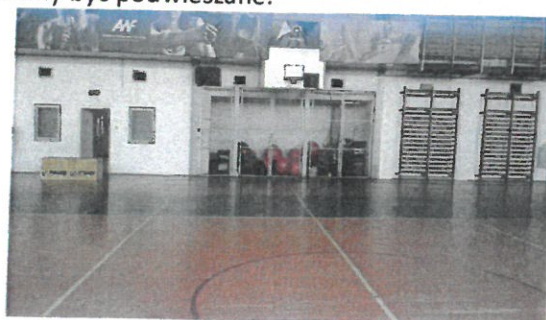
Hala sportowa - parkiet