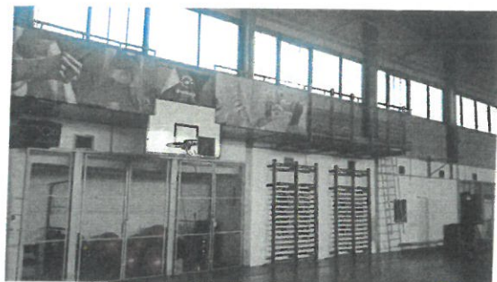
Antresola w hali sportowej