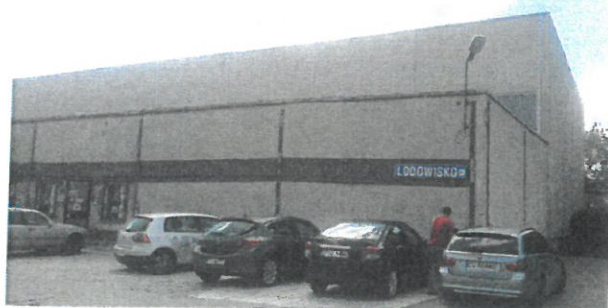
Budynek hali AWF z zewnątrz