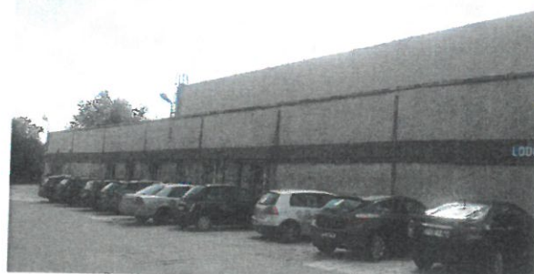
Budynek hali AWF z zewnątrz