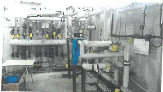
Instalacje w pomieszczeniu technicznym