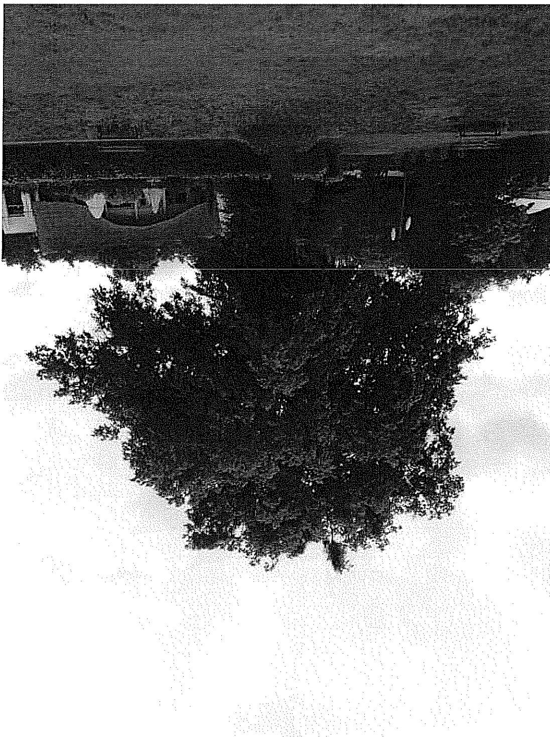
DRZEWO Z RODZAJU LIPA, Z KTÓREGO MA ZOSTAĆ USUNIĘTA JEMIOŁA