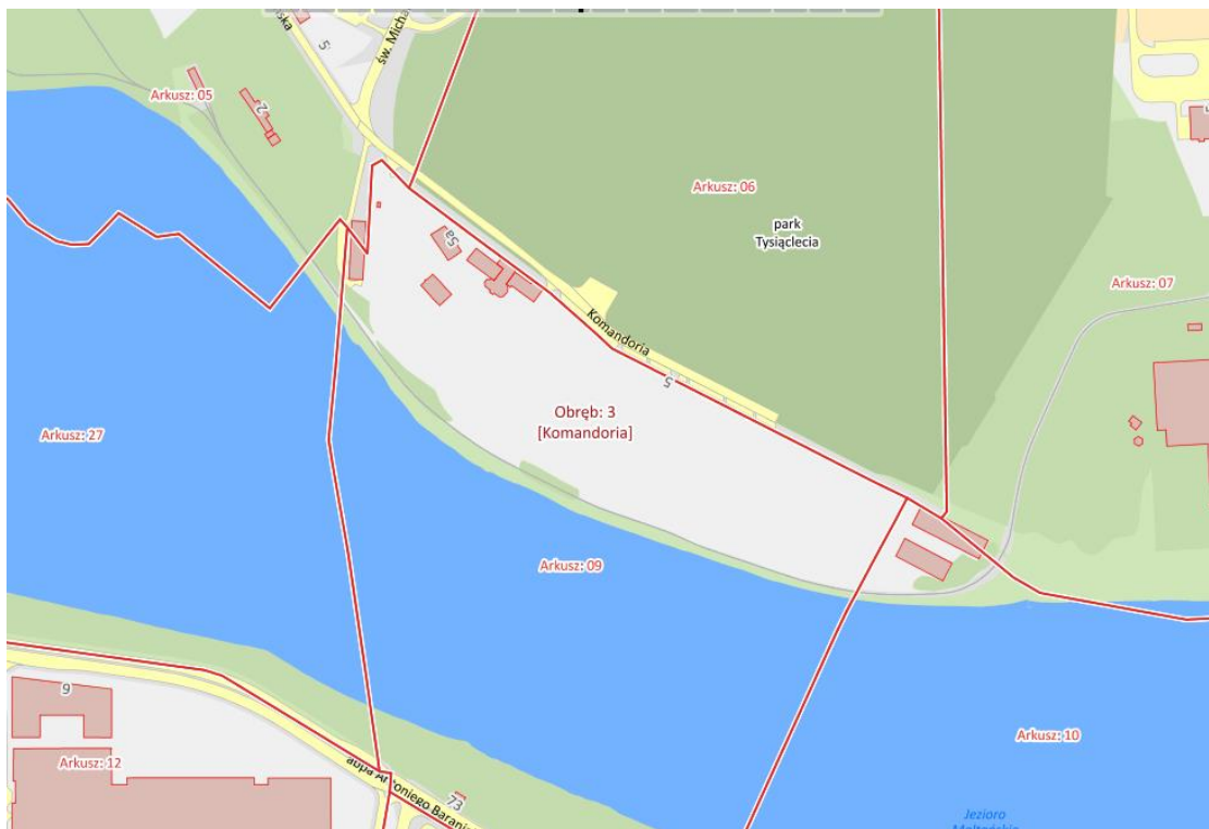
Plan sytuacyjny - mapa