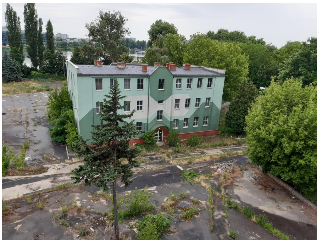
Budynek administracyjno - biurowy