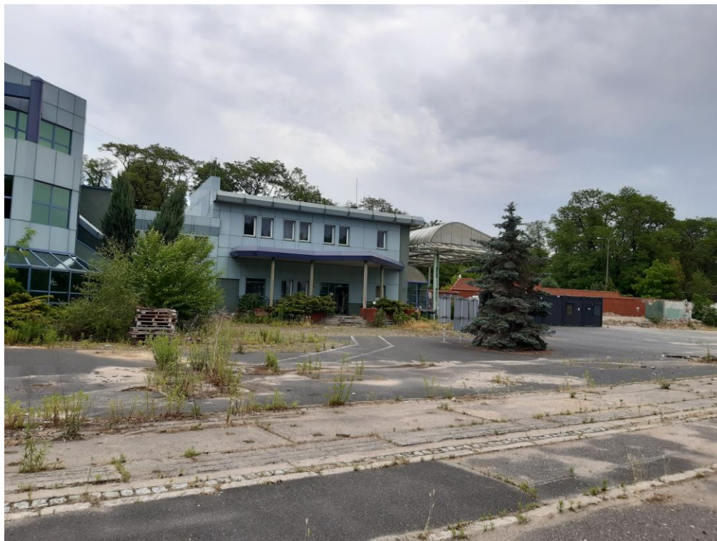
Budynek Portierni „U”