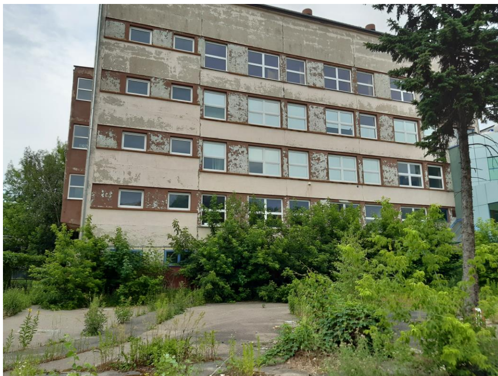
Budynek socjalny C