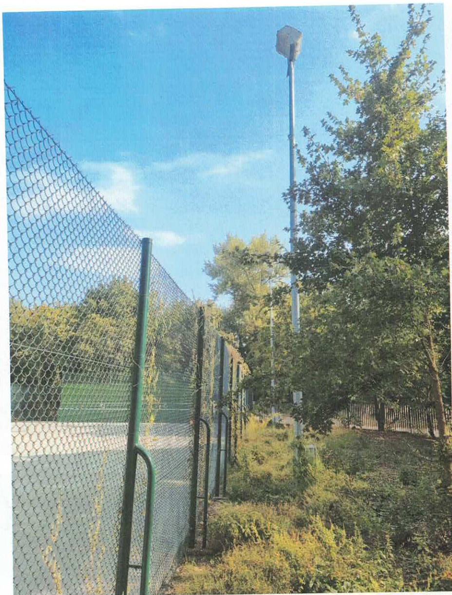
Lampy nr 3 i 4