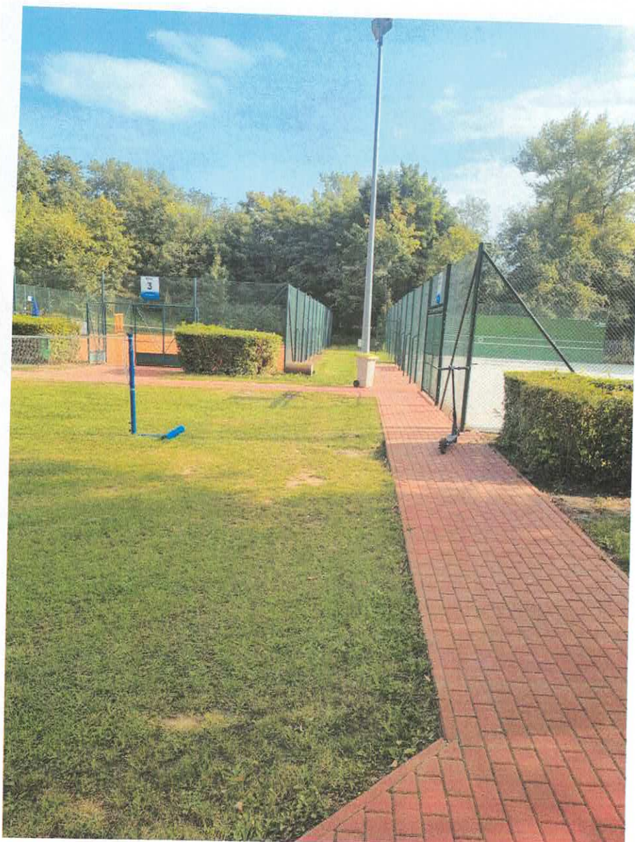
Miejsce ułożenie kabla do lamp nr 3 i 4