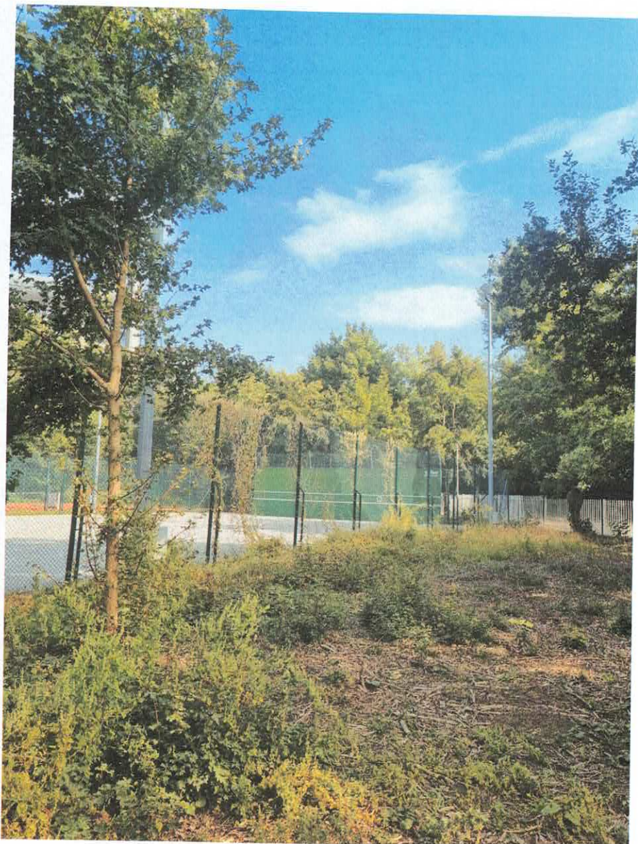
Lampy nr 3 i 4