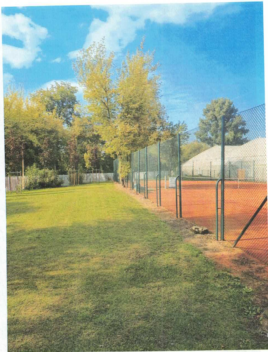
Nowa lokalizacja lamp nr 3 i 4