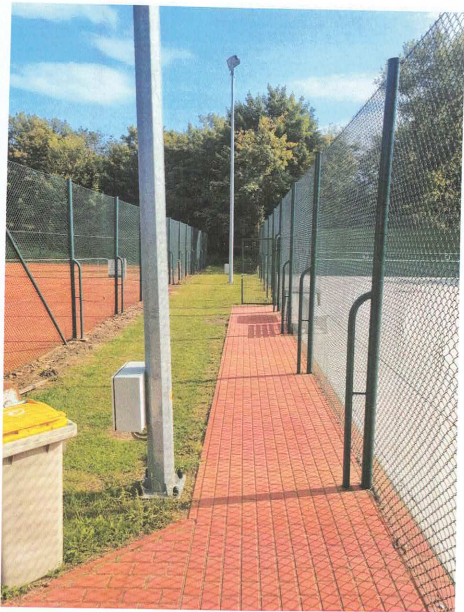
Lampy nr 1 i 2