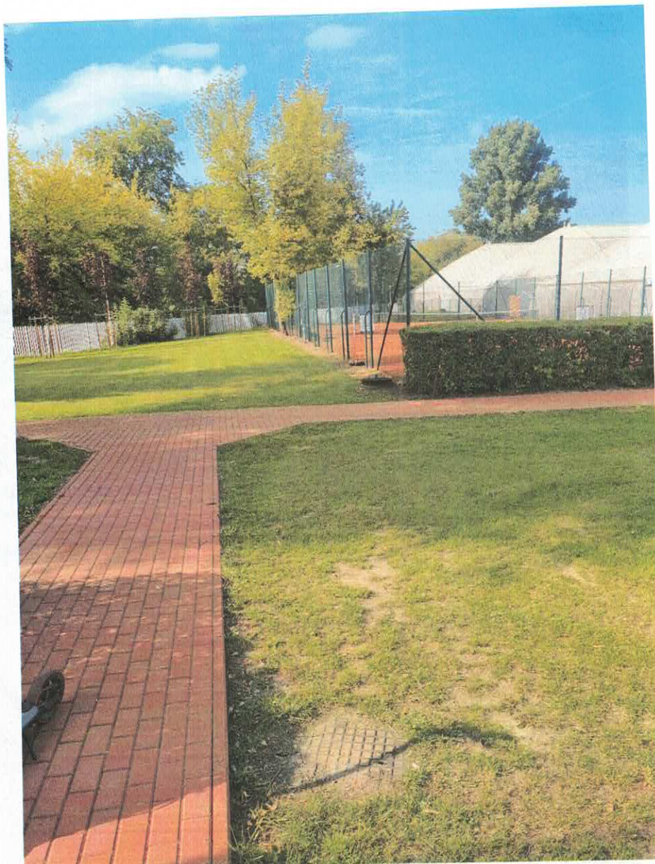
Miejsce ułożenie kabla do lamp nr 3 i 4