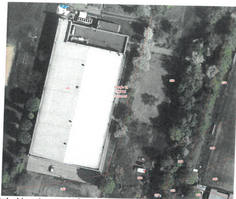
Hala lodowiska - ul. o. Mariana Żelazka w Poznaniu, działka nr 4/20, ark. nr 09, obręb Wilda

pomieszczenia szatni przewidziano osobne wejście z zewnątrz. Zadanie obejmuje badania geologiczne gruntu. Należy sprawdzić dotychczasowe posadowienie.