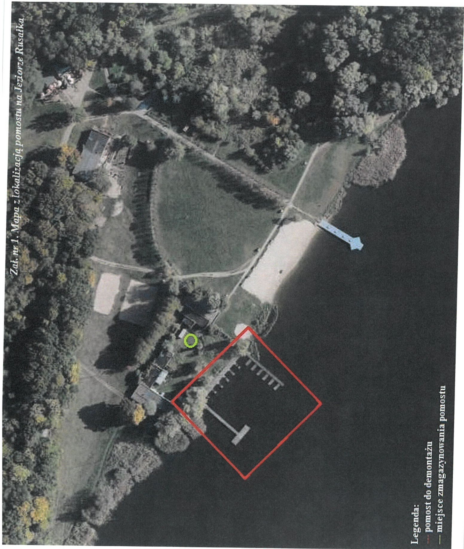
Załącznik nr 1. Mapa z lokalizacją pomostu na Jeziorze Rusalka